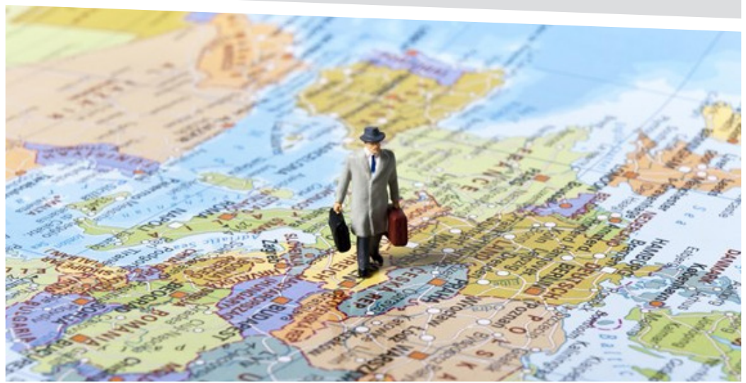
1 "EU Commission report on the operation of Directive 2011/24/EU on the application of patients' rights in cross-border healthcare (4th September 2015)";

Európában csak 10 %-uk tudja, hogy léteznek a Nemzeti Kapcsolattartó Pontok, Magyarországon csak 16%. 1