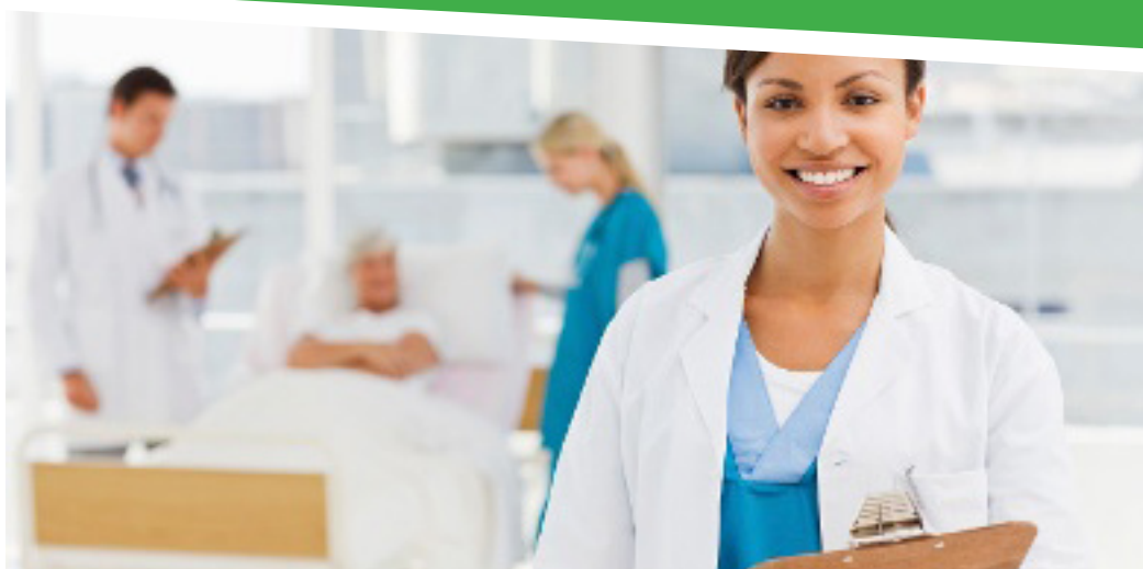
2. A zöld háttérű szöveg forrása: "Egészségügyi ellátás igénybe vétele egy másik uniós tagállamban: az Ön jogai", mely az Európai Bizottság kiadványa